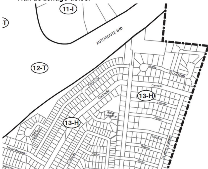
Plan de zonage actuel